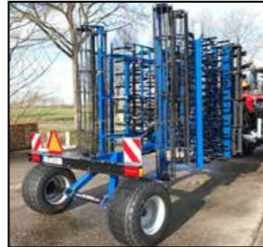
Smal, voor wegtransport